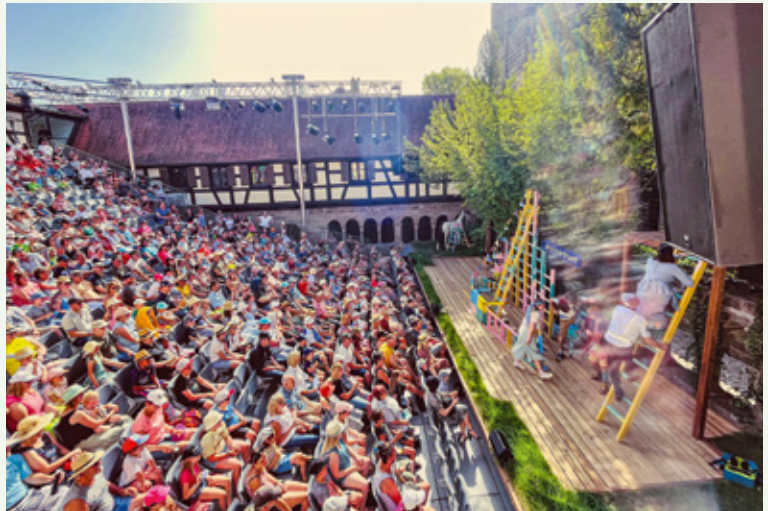
Noch läuft der Theatersommer 2022 – unter anderem mit „Pippi Langstrumpf“ (Foto). Das Programm der Kreuzgangspiele für 2023 steht aber auch schon fest. (Foto: © Nicole Brühl)

Endspurt bei den Festspielen 2022: Noch bis zum 14. August 2022 wird im Kreuzgang Theater gespielt. Hinter den Kulissen wurde schon seit geraumer Zeit an der neuen Spielzeit gearbeitet. Am 20. Juli hat der Feuchtwanger Stadtrat den Spielplan für die Sommer-Saison 2023 beschlossen: Es gibt wieder jede Menge Theater auf den Bühnen im Kreuzgang und im Nixel-Garten, Stücke voller Leben und Humor – und dazu feiern die Kreuzgangspiele ihr 75-jähriges Jubiläum mit einem großen Spiel auf dem Marktplatz.