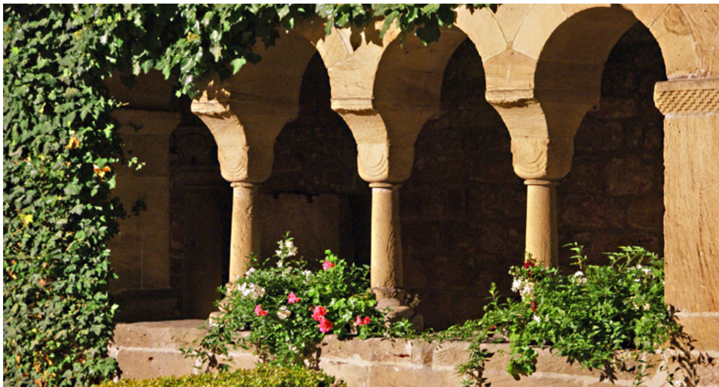
Der Feuchtwanger Kreuzgang

Info-Telefon für Veranstaltungen: Tourist-Information 09852/904-55 Änderungen vorbehalten!