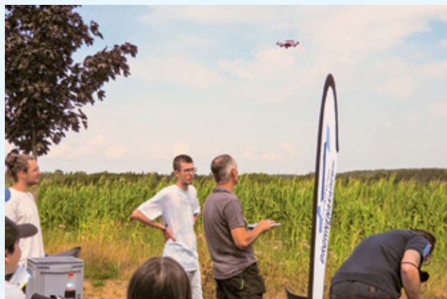
Selbst das Steuern einer Drohne übernehmen konnten die Besucher bei der Drohnenakademie im Parkour auf dem Freigelände

Das Wetter hat uns ebenfalls in die Karten gespielt: Nach anfänglich grauem Himmel strahlte den ganzen restlichen Tag die Sonne und ermöglichte gemütliches Beisammensitzen im Freien sowie zahlreiche Aktivitäten, die besonders bei unseren kleinen Gästen auf große Begeis-