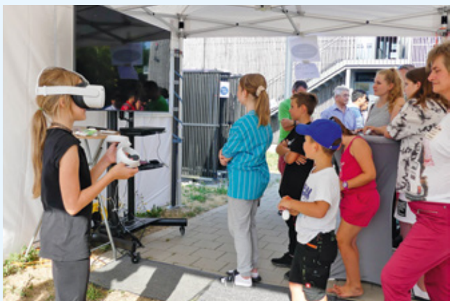
Begeisterung bei der Besichtigung in Virtual-Reality des zukünftigen Vorlesungsgebäudes am Campus Feuchtwangen.

Das Wetter hat uns ebenfalls in die Karten gespielt: Nach anfänglich grauem Himmel strahlte den ganzen restlichen Tag die Sonne und ermöglichte gemütliches Beisammensitzen im Freien sowie zahlreiche Aktivitäten, die besonders bei unseren kleinen Gästen auf große Begeis-