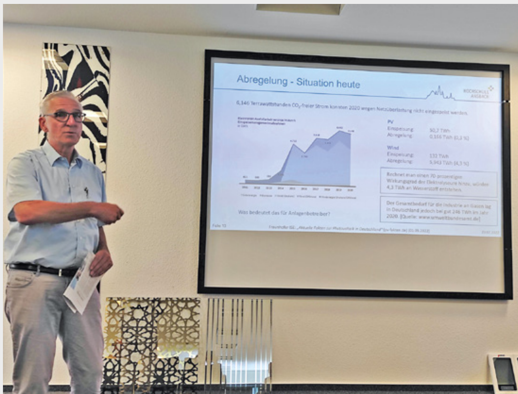
Am 20. Juli fand das dritte Strategiegelgespräch des HyStarter-Projektes des Zweckverbandes InterFranken zur Initiierung einer Wasserstoffwirtschaft statt.

diesem Sinne möchte die Geschäftsführung alle regionalen Akteure auffordern, sich an der Erarbeitung eines Konzeptes zur Erzeugung und Nutzung von „grünem“ Wasserstoff für den Industriepark zu beteiligen. Interessierte wenden sich bitte unter Angabe von möglichen Schwerpunkten für eine zukünftige Beteiligung und Mitarbeit im „HyStarter“-Projekt an die Geschäftsführerin des Zweckverbandes InterFranken, Frau Hedwig Schlund, e-mail: h . s c h l u n d @ interfranken.de.