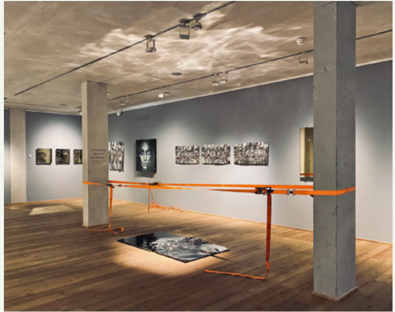
Blick in die Ausstellung „reFORMATION“ im Fränkischen Museum.