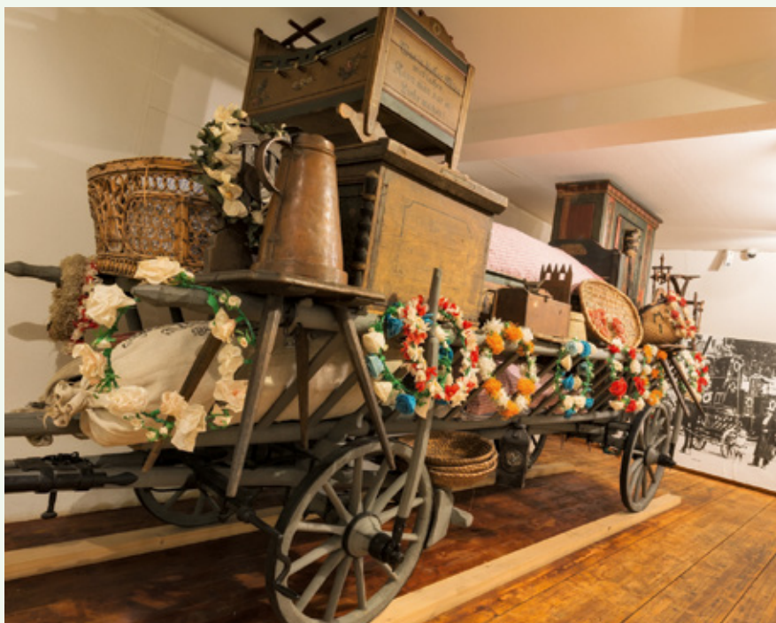
Einblick in das Fränkische Museum Feuchtwangen

Führungen für Gruppen können auch jederzeit außerhalb der öffentlichen Führungstermine über das Fränkische Museum Feuchtwangen, Tel.: 09852/2575 gebucht werden.