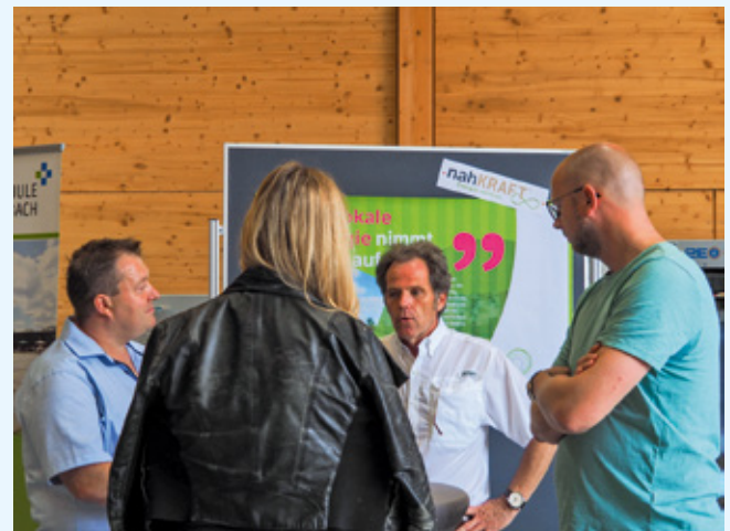
Partner wie die nahKRAFT (im Bild), SIEMENS oder Layer Manufactory boten Besuchern die Gelegenheit zum persönlichen Austausch.