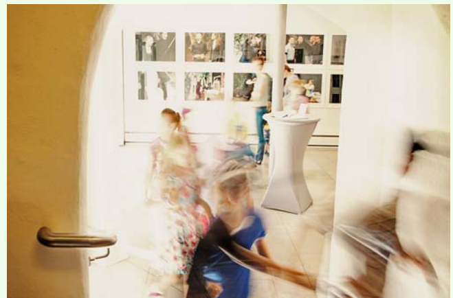
Für Kultur- und Menschenfreunde: Im Sommer 2021 brauchen die traditionsreichen Kreuzgangspiele Hilfe an der Theaterkasse und im Einlass – ein abwechslungsreicher Job mit viel Kundenkontakt.