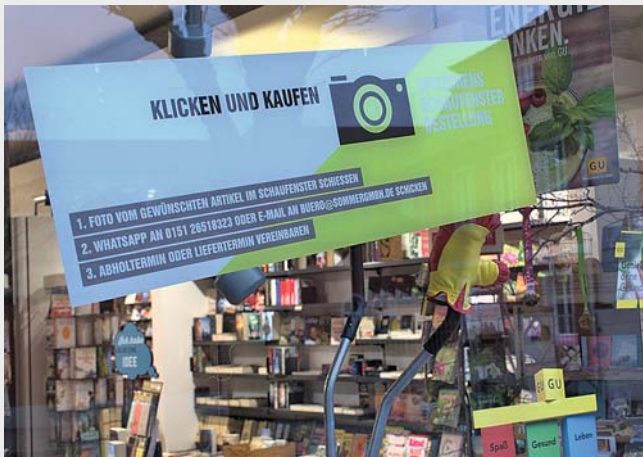
Alle Feuchtwanger Geschäfte mit diesem Aufkleber im Schaufenster nehmen an der Aktion „klicken und kaufen“ teil.

schließend per WhatsApp oder E-Mail an das teilnehmende Geschäft schicken und einen persönlichen Abhol- beziehungsweise Liefertermin vereinbaren.“ Wie der Stadtmarketingleiter weiter informierte, sei das Schaufenster-Shopping in der Kreuzgangstadt bei den ersten Läden bereits ab sofort möglich. Alle teilnehmenden Ge-