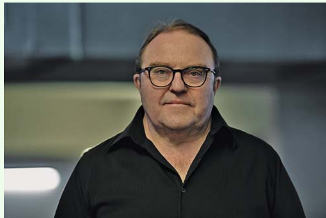
Der Schauspieler Gustav Peter Wöhler.

Weitere Informationen zur Konzertreihe KunstKlang, die seit 2014 unter künstlerischer Leitung von Christiane Karg stattfindet, gibt es unter www.kunstklang-feuchtwangen.de