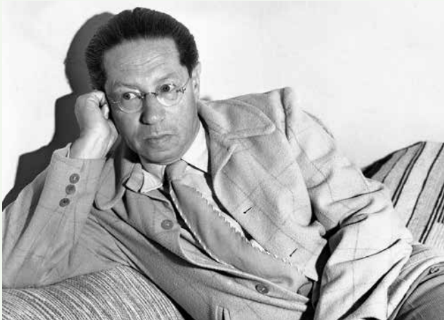
Der Romancier Lion Feuchtwanger hat Wurzeln in Feuchtwangen.

Eine Lesung aus Texten Lion Feuchtwangers