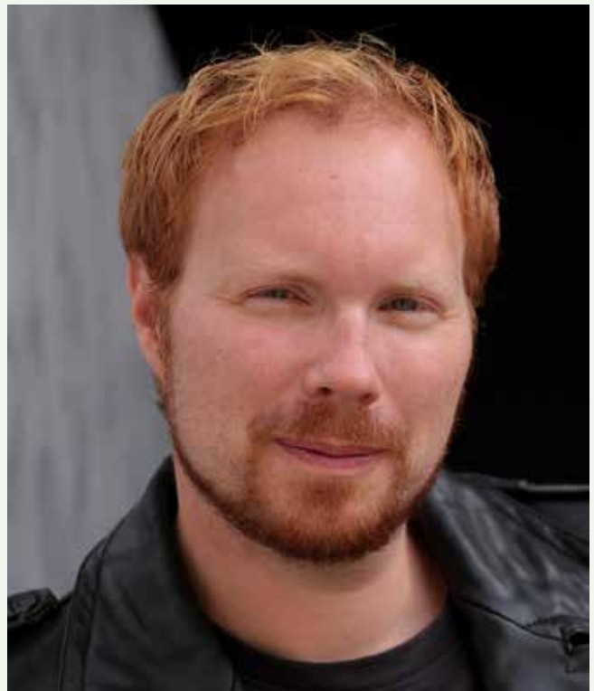
Der Schauspieler, Regisseur und Medienkünstler Alexander Ourth konzipiert im Rahmen des Festjahres eine Medieninstallation im Fränkischen Museum, er ist für Fassung und Regie der Performance „Lass uns verschwinden!“ verantwortlich. Am 8. Oktober 2021 liest er aus den Tagebüchern Lion Feuchtwangers.

Karten und Informationen gibt es im Kulturbüro der Stadt Feuchtwangen, Marktplatz 2, 91555 Feuchtwangen, Telefon 09852 90444; sowie im Internet auf www.juedisches-feuchtwangen.de