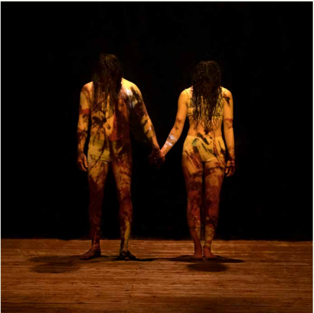
Die Theaterperformance „Lass und verschwinden!“ hat am 12. November 2021 in der Stadthalle Kasten Premiere – in ihr verschmelzen Tanz, Schauspiel und Performance. Weitere Vorstellungen gibt es bis zum 19. November 2021.

sich mit Mechanismen des Erinnerns und des Vergessens beschäftigt, und in der Schauspiel, Tanz und Performance zu einem einmaligen Theatererlebnis verschmelzen. Premiere ist am 12. November in der Stadthalle Kasten. Weitere Vorstellungen finden bis zum 19. November statt. Karten und Informationen gibt es im Kulturbüro der Stadt Feuchtwangen, Marktplatz 2, 91555 Feuchtwangen, Telefon 09852 90444; sowie im Internet auf www.juedisches-feuchtwangen.de