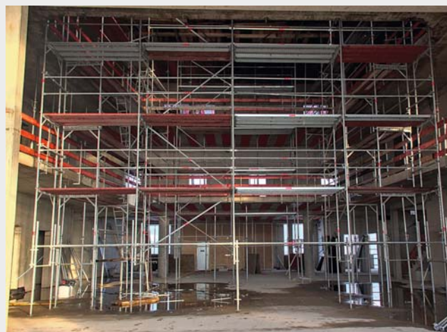
Blick von der künftigen Bühne in die Aula, im Hintergrund wird der Haupteingang sein: Bereits jetzt im Rohbau und trotz Gerüst bietet die große Aula der neuen Land-Schule einen imposanten Anblick.