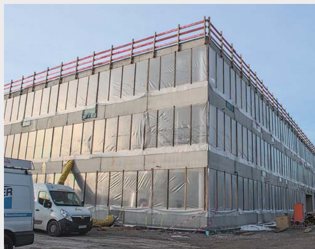
Der Rohbau der neuen Feuchtwanger Land-Schule steht. Mitte Dezember wurden unter anderem alle Fenster mit einer speziellen Folie abgedeckt, um das gesamte Gebäude regendicht zu verschließen.

Insgesamt soll die neue Schule über 23 Klassenräume verfügen. Acht Klassenzimmer sind dabei für die Grundschule und weitere 15 Klassenräume für die Mittelschule