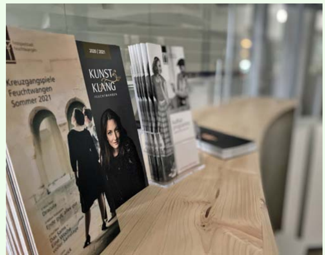
Das Kulturbüro und die Theaterkasse sind bis zum 10. Januar 2021 geschlossen.

Alle Informationen zum Museum gibt es auch auf www.fraenkisches-museum.de