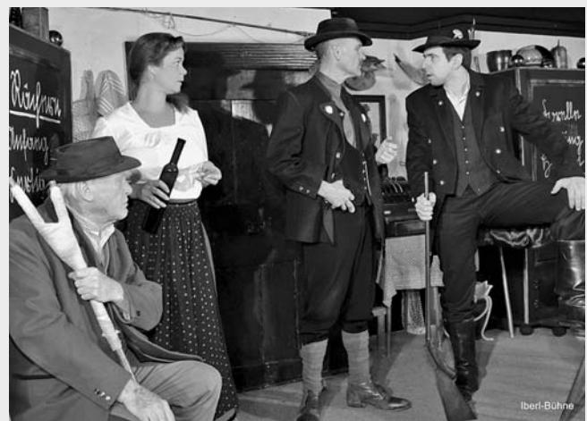
Am 15. Februar ist im Landgasthof die Komödie „Wuidschütz'n“ zu sehen.