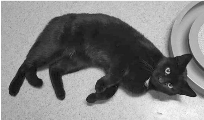
Suna sucht ein Zuhause