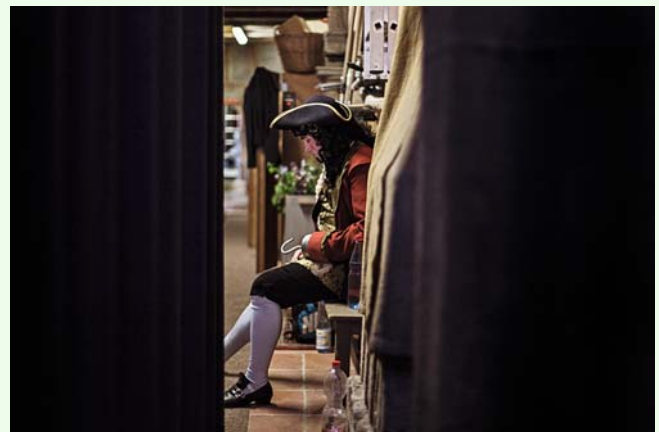
Für die Kultur heißt es jetzt: Warten, wie es weitergeht.

Selbstverständlich ist es auch möglich, nicht auf eine Erstattung des Kartenpreises zu bestehen, sondern diesen der Kultur in Feuchtwangen als Spende zur Verfügung zu stellen.