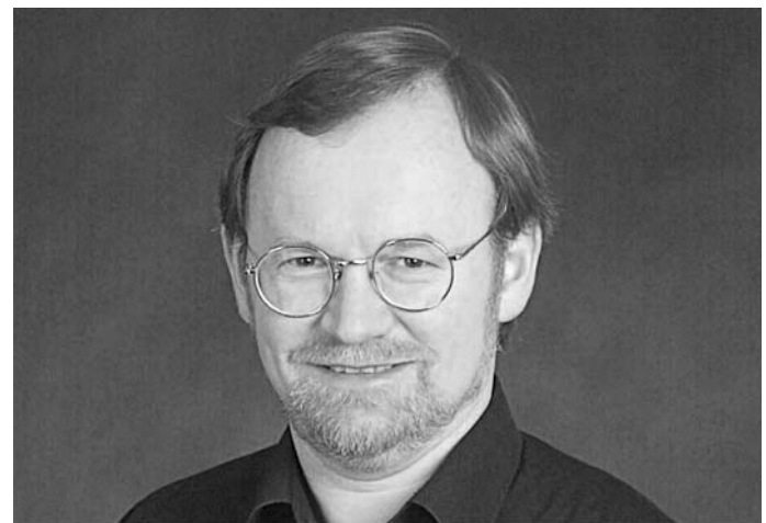
Veranstalter: Kath. Kirchengemeinde St. Ulrich und Afra Feuchtwangen