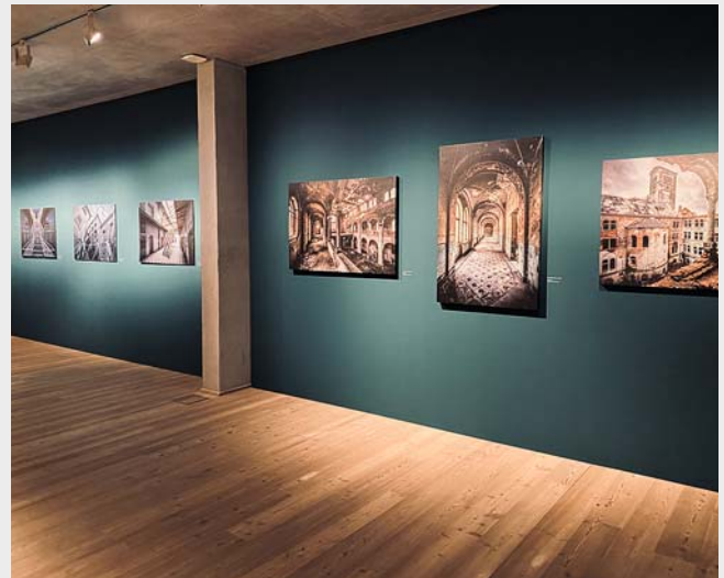
Die Ausstellung zeigt Fotografien von so genannten „lost places“, also verlassenen Orten, noch bis zum 13. Dezember 2020.

am 13.12. bis 20 Uhr geöffnet. Dadurch haben noch mehr Interessierte die Möglichkeit sowohl die Dauerausstellung als auch die Ausstellung „Lost places“ zu besuchen.