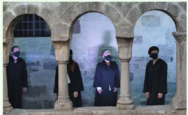
Die Reise beginnt mit Boccaccio im 14. Jahrhundert, in einer Zeit, in der die Pest in Florenz fürchterlich wütete, aber klug und abwechslungsreich führt Regisseur Johannes Kaetzler Publikum und Ensemble in die Gegenwart.