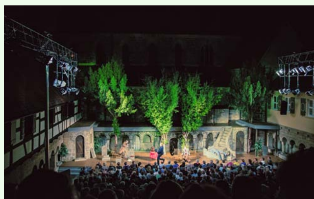
Mit ihrem einzigartigen Flair erfreuen sich die Kreuzgangspiele immer größerer Beliebtheit.

Seit einigen Jahren erfreuen sich die Kreuzgangfestspiele immer größerer Beliebtheit. Dies zeigt sich zum einen an der hohen Besucherzahl von über 50.000 Zuschauerinnen und Zuschauern in der Spielzeit 2019, aber auch im nach wie vor sensationell verlaufenden Vorverkauf. Inzwischen sind über 22.000 Karten für die kommende Saison verkauft worden – wieder ein Rekord!