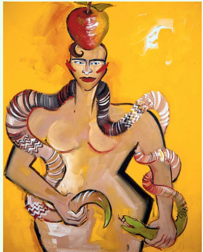
Titel der Ausstellung: Elvira Bach, Am Anfang war der Apfel , 1993.

der in dieser Zeitspanne aktuellen Strömungen der Kunst. Sie treten in den Dialog mit gesellschaftspolitischen Fragestellungen. Sie sind kritisch und hinterfragen das eigene Genre oder übertreten bewusst Genre Grenzen. Sie kommentieren die Ästhetik der Popkultur und