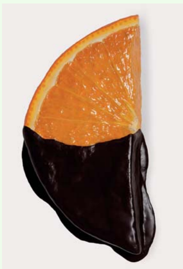
Zum Anbeißen: Peter Anton, Chocolate dipped orange slice, 2007.