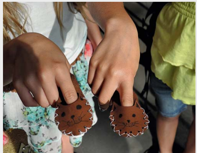
Foto: Selbstgenähte Lederpantoffel.

Museumspädagogische Führungen für Schulklassen oder Kindergruppen können jederzeit über das Fränkische Museum Feuchtwangen, Telefon: 09852/61 52 24 gebucht werden.