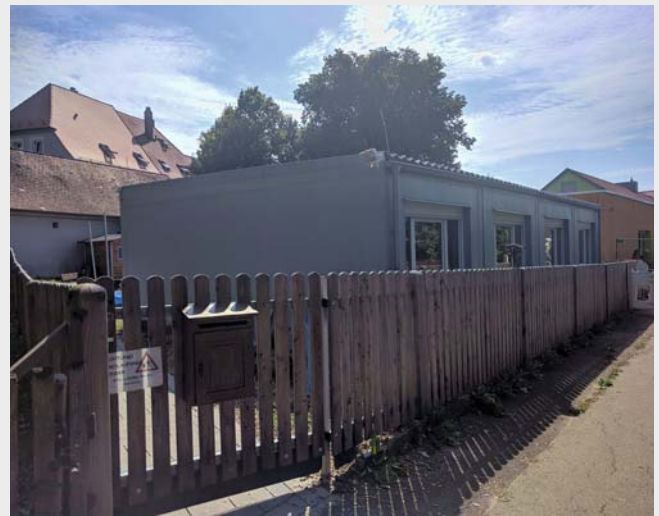
Das Modulgebäude am Sandweg bleibt vorerst in Betrieb.

Mit fertiggestellter Sanierung und Erweiterung des Kindergartens Sandweg stehen laut Betriebserlaubnis in allen Feuchtwanger Einrichtungen 471 Plätze zur Verfügung, wovon 132 Plätze für Kleinkinder unter drei Jahren vorgesehen sind. Da die aktuellen Bedarfsanmeldungen für einen Kleinkindbetreuungsplatz das momentane Angebot übersteigen, bleibt das Modulgebäude am Sandweg mit zwölf zusätzlichen Krippenplätzen vorerst in Betrieb, informiert Bürgermeister Ruh. Somit konnte die Stadt zusammen mit der bereits im Jahr 2013 in der Rothenburger Straße 1 geschaffenen gemischten Gruppe mit weiteren zwölf Plätzen allen Feuchtwanger Kindern ab September einen Betreuungsplatz anbieten. Dabei wurde bei der Vergabe versucht, die Kinder entsprechend den bei der Anmeldung geäußerten Wunschplätzen bestmöglich einzuteilen, allerdings konnte nicht immer der favorisierte Kindergarten berücksichtigt werden.