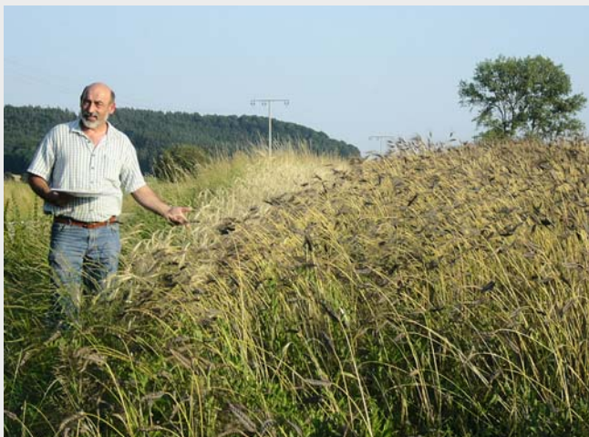
Herr Binder

Am Samstag, 13. Juli findet von 11 bis 13 Uhr eine Emmerfeldbegehung mit anschließender Verkostung statt. Der Spaziergang führt durch blühende Felder, in denen Wildtiere, Wildkräuter und Insekten trotz landwirtschaftlicher Nutzung optimale Lebensbedingungen finden. Während des Spaziergangs erfahren Sie Wissenswertes rund um das Urgetreide Emmer.