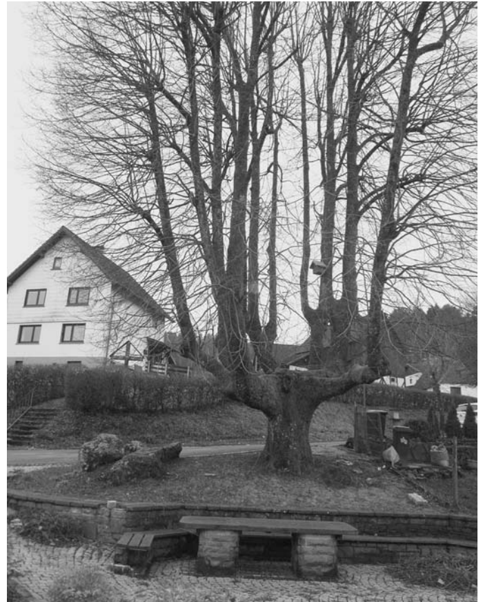
Dorflinden wie diese sind mehr und mehr gefährdet. Doch gerade solche Naturdenkmäler sind schützenswert, meint Annemarie Sanders.