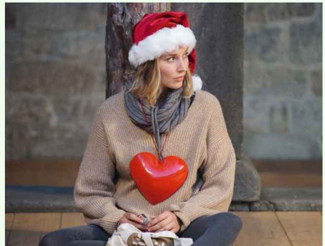
Wie im Himmel_Kreuzgangspiele 2018

Wir bedanken uns bei Ihnen, unserem Publikum, für das wunderbare, erfolgreiche vergangene Jahr und wünschen Ihnen und Ihrer Familie gesegnete Weihnachtstage und einen guten Start im Neuen Jahr. Bleiben Sie der Kultur gewogen!