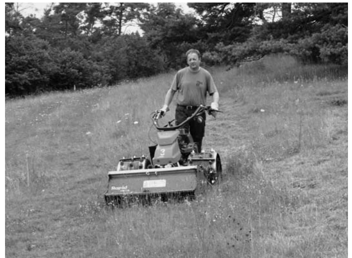
Pflege eines Magerrasens, teils in Handarbeit, teils maschinell unterstützt

Weitere Informationen und Anmeldung beim Landschaftspflegeverband Mittelfranken unter www.lpv-mfr.de , telefonisch unter 0981/4653-3520 oder per Mail an sekretariat@lpv-mfr.de