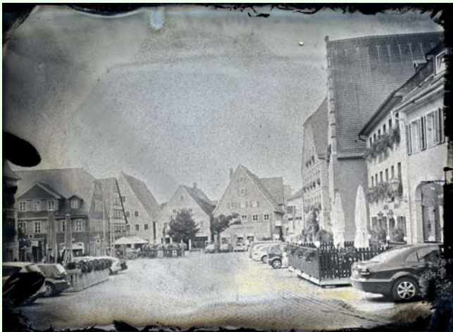
Marktplatz Feuchtwangen, Nasskollodium

Peter Kunz, geboren 1972 in Fürth, erhielt seine Ausbildung zum Mode- und Werbefotografen bei Jochen Schuldt in Nürnberg. Er war als Assistent bei verschiedenen Fotografen im In- und Ausland sowie als freier Fotograf u.a. in Australien tätig. Neben seiner Tätigkeit als Fotograf und Autor studierte er Geschichte, Medienwissenschaften und Philosophie in Erlangen und Venedig. Aktuell arbeitet er als Fotograf, Autor und Redakteur für Zeitungen und Zeitschriften, in der Werbung, an Buchprojekten und ist Dozent vor allem für historische fotografische Verfahren.