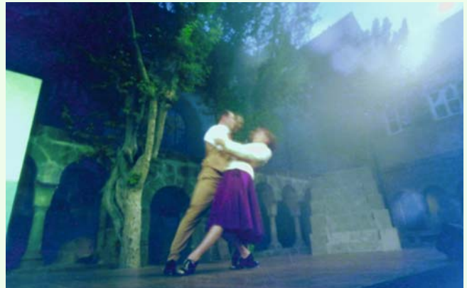
Szenenfoto Kiss me, Kate 2017, Camera obscura

Günter Derleth ist 1941 in Nürnberg geboren. Er absolvierte Ausbildungen zum Schriftsetzer und zum Fotografen, war als Assistent in verschiedenen Fotostudios tätig und hatte von 1971–2002 ein eigenes Studio für Werbephotographie in Fürth. Seit 1993 beschäftigt sich Günter Derleth intensiv mit der Lochkamera, seit 2003 arbeitet er ausschließlich der Camera obscura. Nach 30 Jahren Werbephotographie flieht er förmlich vor dem ständig zunehmenden Technikaufwand und kehrt zurück zu den fotografischen Wurzeln: Zurück zum Einfachen und Wesentlichen, zurück zum Sehen und Fühlen.