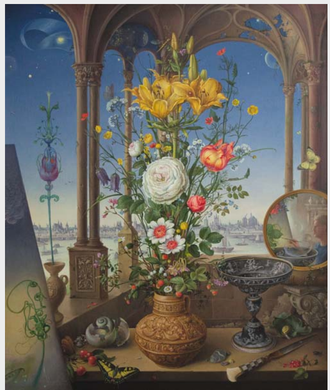
Blumen im Kölner Krug, 1990, Öl auf Leinwand