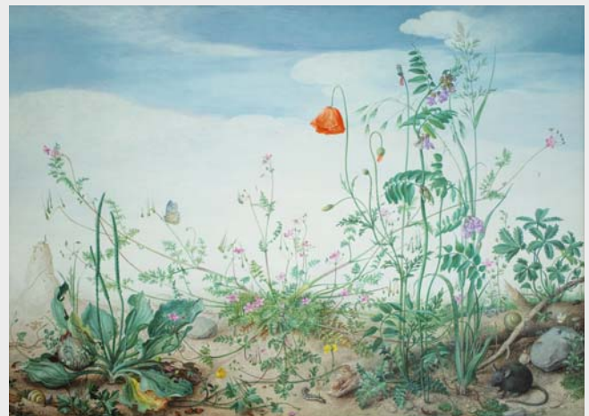
Feldblumen und kleine Tiere im Frühling, 1991–1999, Gouache auf Papier