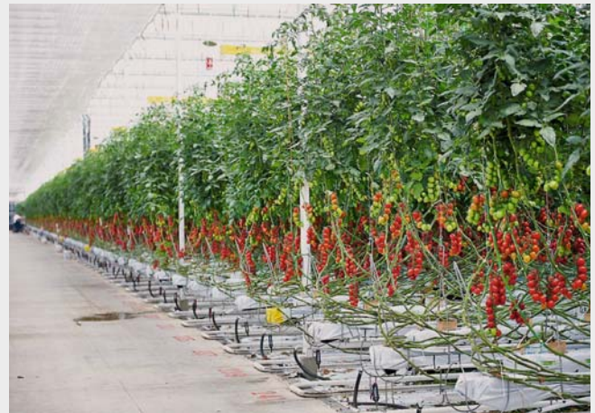
Gemüse Scherzer GmbH

Wenn Sie mitfahren möchten, melden Sie sich bitte im Bürgerbüro an und entrichten dort den Fahrpreis von 14,50 €, darin enthalten ist die Busfahrt, Eintrittspreis