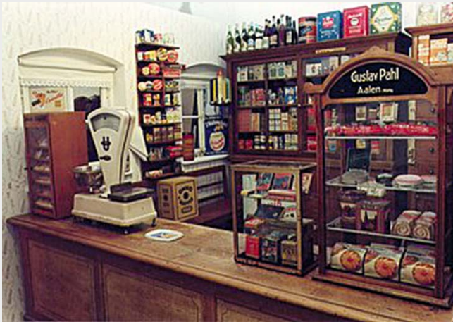
Museum KulturLand Ries

Abfahrt ist um 9.00 Uhr auf der Mooswiese , Rückkehr gegen 17.30 Uhr in Feuchtwangen.