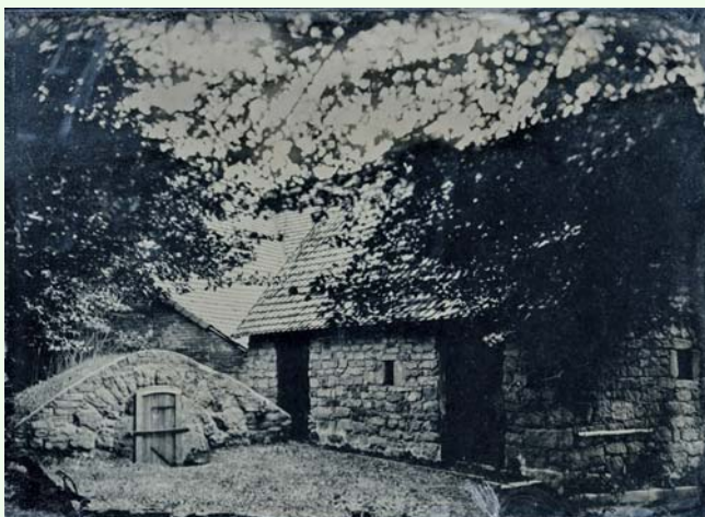
Garten des Fränkischen Museum Feuchtwangen, Nasskollodium

Nachdem der Fotograf Peter Kunz gemeinsam mit seinen Kollegen die Ausstellung bereits mit interessanten Einbli-