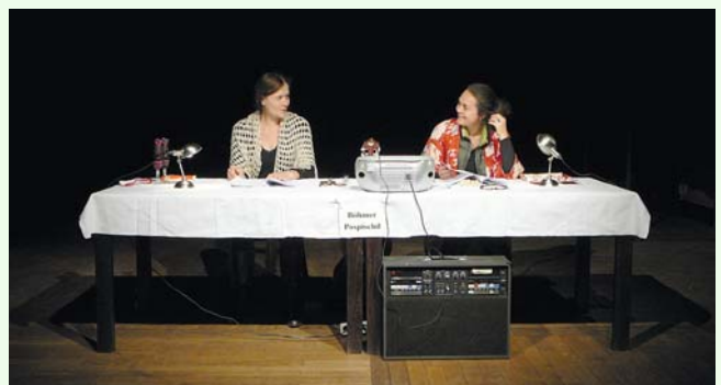
Szenenfoto „Große, kleine Schwester“

Informationen und Karten gibt es im Kulturbüro der Stadt Feuchtwangen, Marktplatz 2, 91555 Feuchtwangen, Telefon 09852/904 44, per E-Mail an kulturamt@feuchtwangen.de , auf www.reservix.de und über die Facebookseite: Kultur Feuchtwangen.