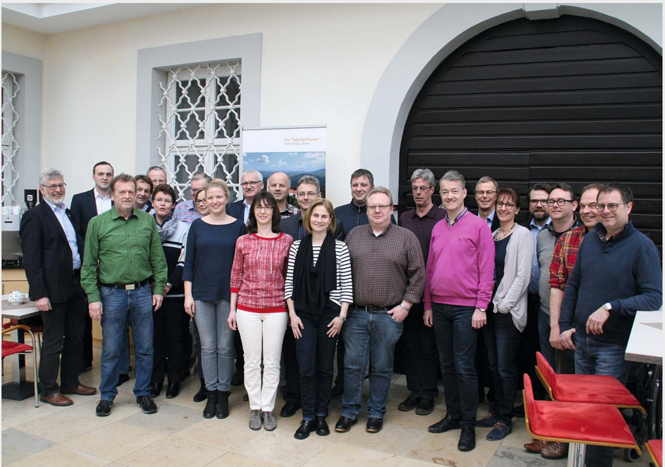
Teilnehmer der Klausurtagung