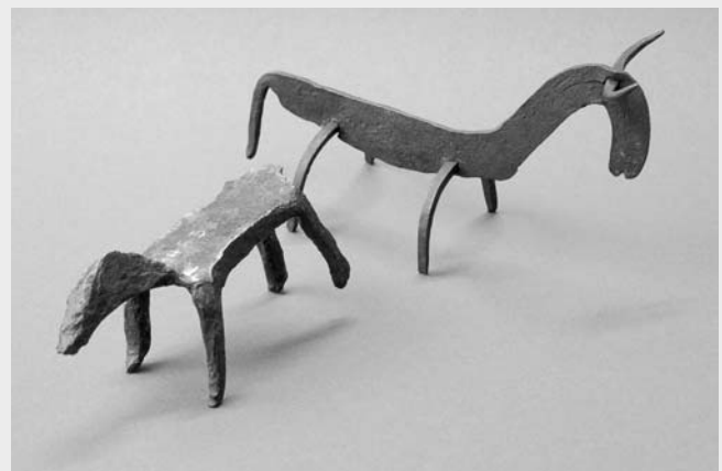
Votivgabe Rinder, Eisen, 16. Jh., aus der 1620 abgebrochenen Leonhardskapelle in Feuchtwangen. Mit derartigen Weihegaben, dem Hl. Leonhard gewidmet, suchte man Viehseuchen von den eigenen Tieren fernzuhalten.

Oktober, November, Dezember: Mi bis So 14–17 Uhr Führungen nach Vereinbarung