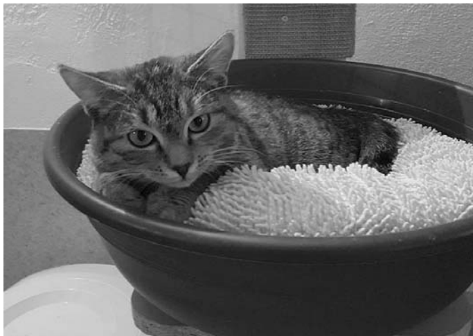
Emma und andere Katzen suchen ein Zuhause.

Die liebe verschmiste Emma kam als Fundkatze zu uns und wurde leider nirgends vermisst, nun suchen wir auf diesem Weg ein neues Zuhause mit Freigang für Emma.