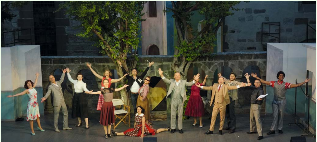
Kiss me, Kate

Karten & Informationen zu allen Kulturveranstaltungen gibt es im Kulturbüro der Stadt Feuchtwangen, Marktplatz 2, 91555 Feuchtwangen, Telefon: 09852/904 44, E-Mail: mail@kreuzgangspiele.de, auf www.kreuzgangspiele.de und auf www.reservix.de