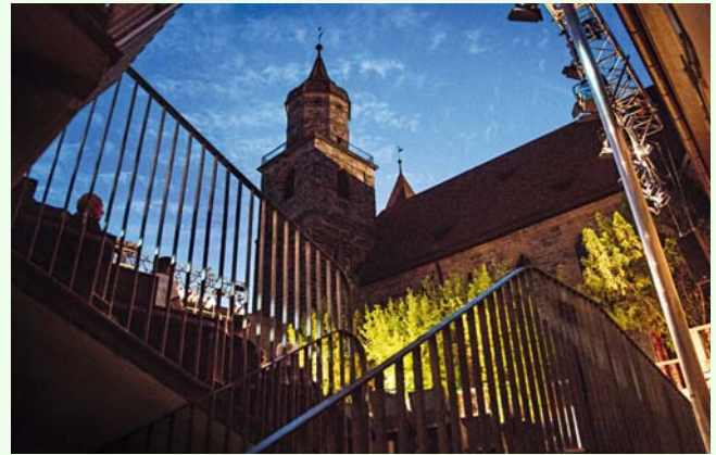
Kreuzgang mit Stiftskirche

Ein besonderes Highlight ist ein Projekt in Kooperation mit der Konzertreihe KunstKlang, in dem Musiker des Barock-Ensembles um Nadja Zwiener mit Musik von Johann Sebastian Bach mit vier klassisch ausgebildeten Tänzern