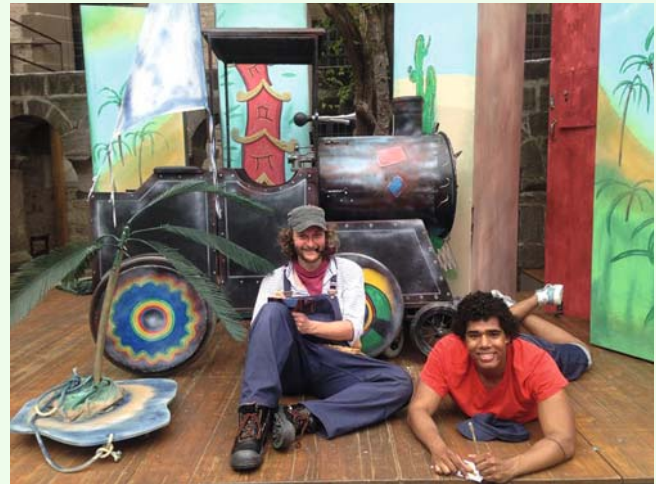
Jim Knopf und Lukas schreiben Postkarten.

Jim Knopf und Lukas der Lokomotivführer Marktplatz 2, 91555 Feuchtwangen