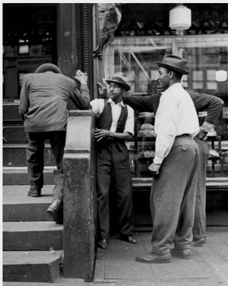
Am 29. Mai wird der Feuchtwanger Kunstsommer mit Fotografien von Andreas Feininger aus dem New York der 1940er Jahre eröffnet. Foto: Harlem Arm Wrestling © Andreas Feininger Archiv c/o Zeppelin Museum Friedrichshafen