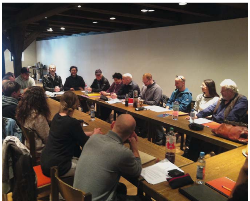
Am 4. Mai kamen das Ensemble zur ersten „Brandner“-Probe zusammen.

Details zu den Stücken sowie zu unseren Schauspielern gibt es auch auf www.kreuzgangspiele.de und auf Facebook.