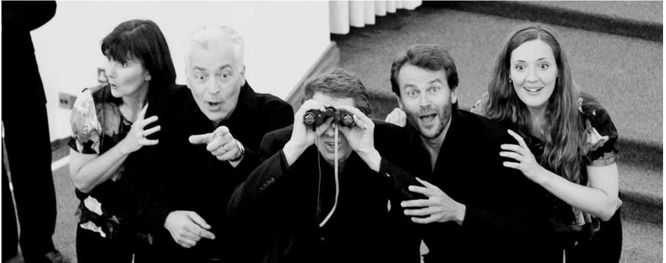
Die nächste KunstKlang-Saison startet mit dem preisgekrönten Ensemble „I Fagiolini“ am 19. Juli.