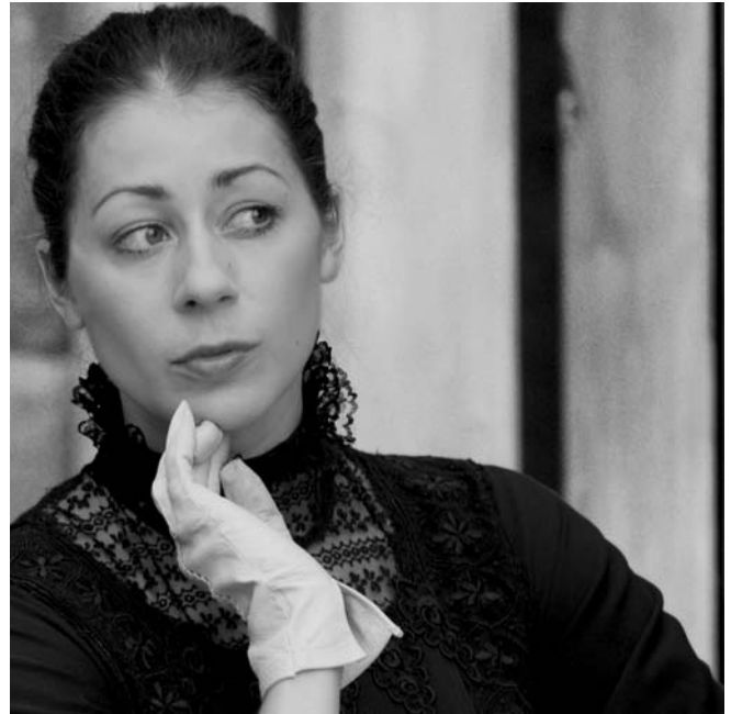
Titelbild des neuen Prospekts

Alle Informationen zu den Kreuzgangspielen erhalten Sie im Kulturbüro, Marktplatz 2, 91555 Feuchtwangen, Tel.: 09852/904 44, mail@kreuzgangspiele.de; oder auf unserer Internetseite www.kreuzgangspiele.de