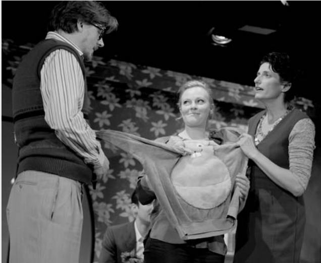
Württembergische Landesbühne: Venedig im Schnee