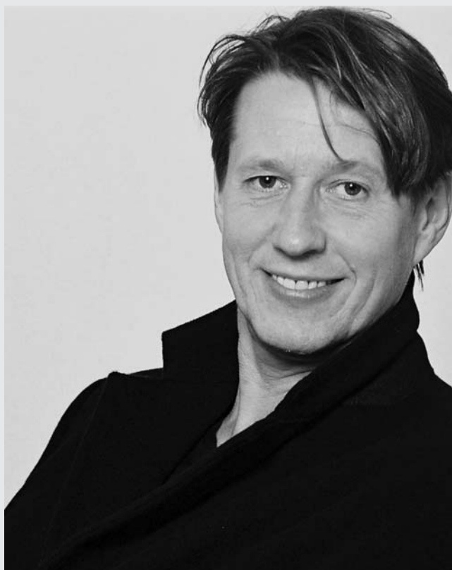
Rebers – muss man mögen