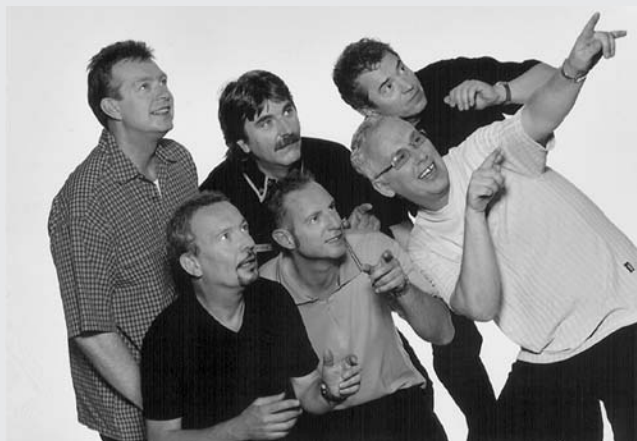
Spider Murphy Gang

5. bis 10. November Fisch- und Wildtage 2013