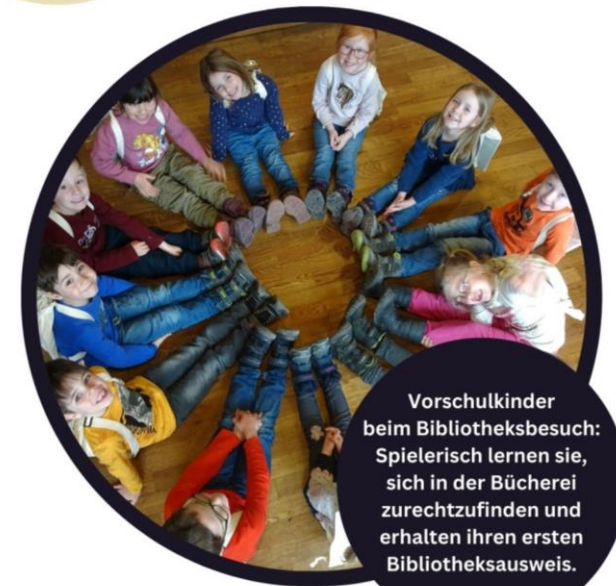
Vorschulkinder beim Bibliotheksbesuch: Spielerisch lernen sie, sich in der Bücherei zurechtzufinden und erhalten ihren ersten Bibliotheksausweis.