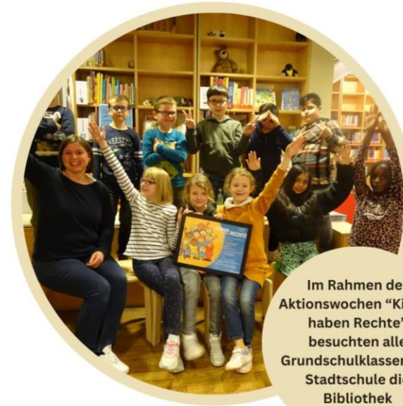
Im Rahmen der Aktionswochen "Kinder haben Rechte" besuchten alle Grundschulklassen der Stadtschule die Bibliothek

* Gesamtsumme enthält 11.709 Pauschalverlängerungen aufgrund coronabedingter Schließungen