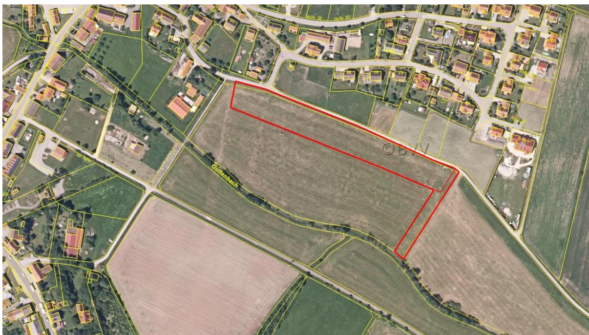
Abb. 1: Geltungsbereich des Bauvorhabens in Archshofen (rote Abgrenzungen). Die feine rote Linie grenzt die geplante Wohnbebauung vom Regenwasserkanal ab.

Der Geltungsbereich des Vorhabens besteht ausschließlich aus Grünland als Teil der Flur Nr. 314 (Titelbild, Abb. 2, 3, 4). Im Norden grenzt ein überwiegend geschotterter Weg an (Flur 303), der im Rahmen des Bebauungsplanes als Straße ausgebaut wird (Titelbild, Abb. 2, 3). Nördlich des Weges liegt ein ca. 30-50 m breiter Streifen aus Wiesenparzellen (z.T. Pferdekoppel) (Fluren 280, 288, 289, 299, 301). Nördlich davon grenzt Wohnbebauung an. Am Westrand des Geltungsbereiches verläuft eine Fernwasserleitung durch die Wiesenflur und westlich davon folgt Wohnbebauung. Im Osten setzt sich Grünland fort. Im Süden verläuft der v.a. auf seiner Südseite von Bäumen und Baumgruppen lückig gesäumte Guttenbach. Das geplante RRB im Osten des Geltungsbereiches wird etwa 12-15 m an den Bach heranreichen und mittels Verrohrung in diesen entwässern (Abb. 5, 6). Im westlichen Abschnitt überspannt eine 20 kV-Freileitung die geplante Wohnbebauung. Die Leitung verläuft von einer Turmstation in Flur 298 am Rand der Bestandssiedlung südwärts über die Aue des Guttenbachs hinweg und soll abgebaut werden.