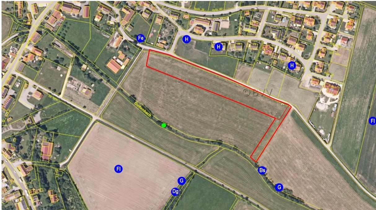
Abb. 9: Brutviere artenschutzrechtlich relevanter Vogelarten im Untersuchungsraum 2020. Bs: Buntspecht (kein Brutplatz, nur einmaliger Nachweis), Dg: Dorngrasmücke, Fe: Feldsperling, Fl: Feldlerche, G: Goldammer, H: Haussperling. Der grüne Punkt markiert ein Nest (Größenklasse: Krähe, Elster, Ringeltaube) im Baumwipfel am Guttenbach.