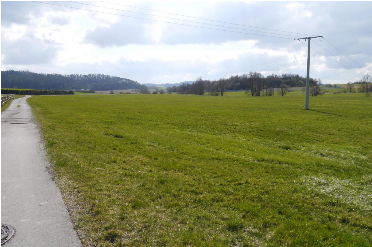
Abb. 2: Blick von Westen auf den Bereich der geplanten Wohnbebauung. Links im Bild Flurweg am Nordrand des Geltungsbereiches. Die querende Freileitung wird abgebaut. Aufnahme datum: 31.03.2020.