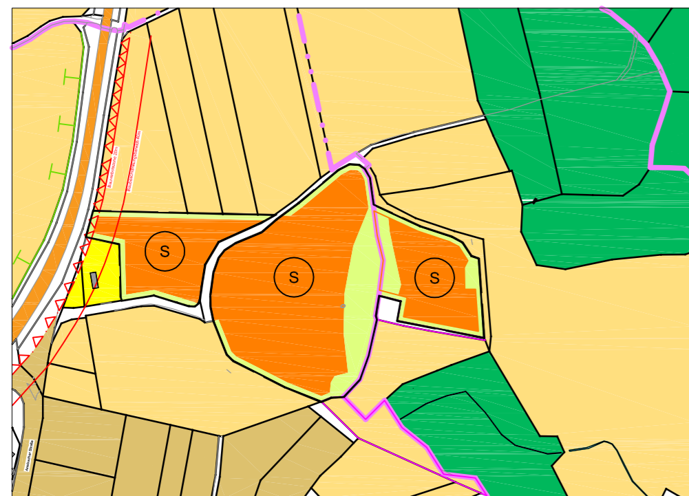
20. Änderung des Flächennutzungsplans der Stadt Feuchtwangen